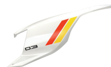
Heritage White II